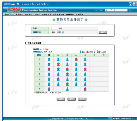
教員希望条件設定画面