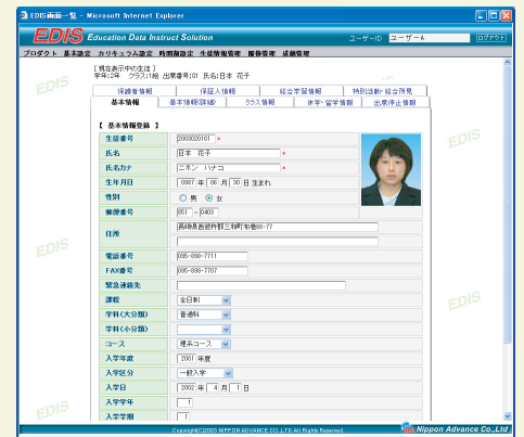
生徒情報登録画面