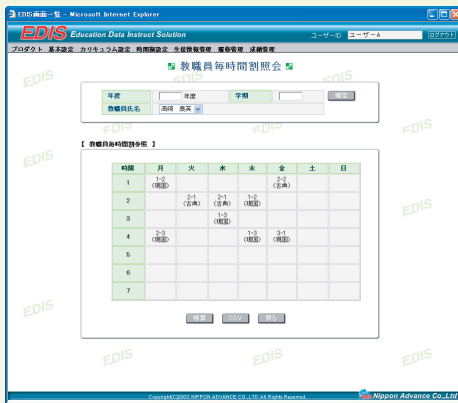
教職員毎時間割照会画面